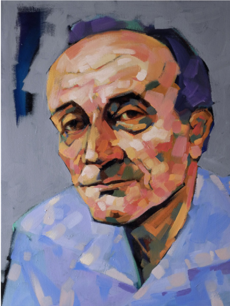
ERVIN ERŽEN 3, 2017, olje na platnu